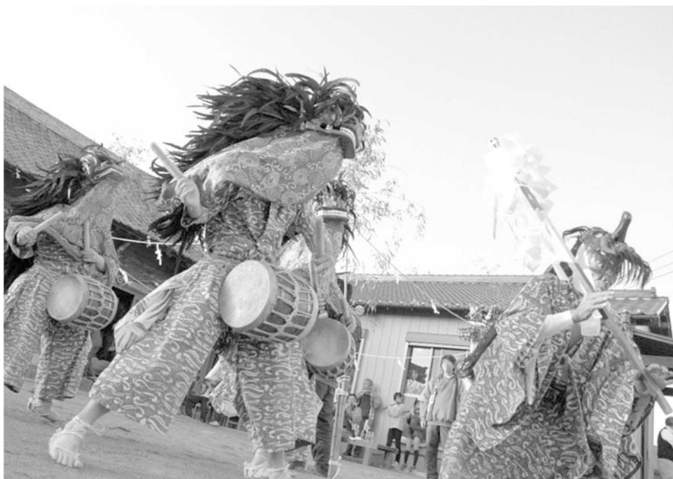
市指定無形民俗文化財（除堀の獅子舞）