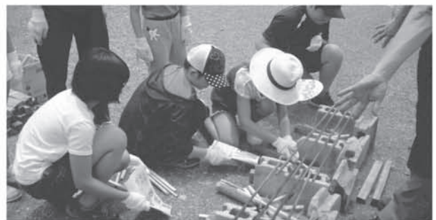
鷲宮公民館事業 「子どもわくわく体験教室（飯ごう炊さん）」