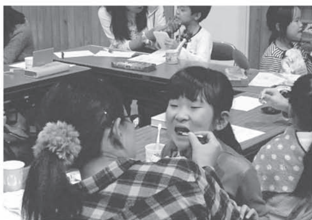
豊かな人間性を育む教育の充実 1年生親子ふれあい活動 (青毛小学校)