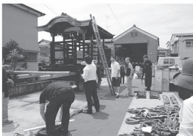
久喜八雲神社の山車行事調査