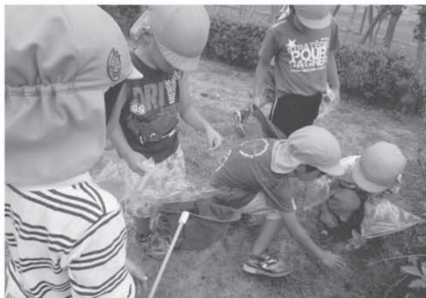
遊びを通じた友達や自然との触れ合い (栗橋幼稚園)