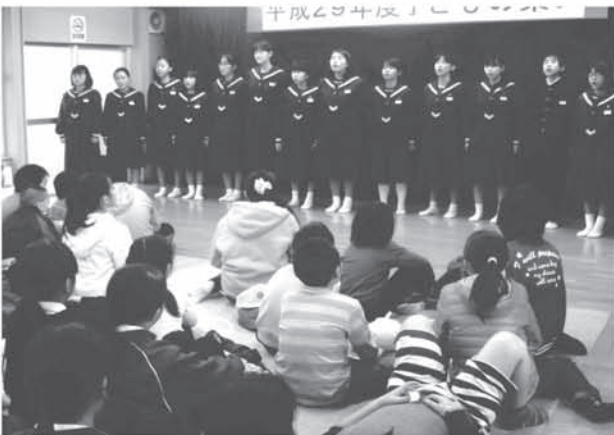
野久喜集会所 子どものつどい