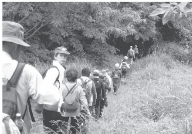
スポーツ教室 (ハイキング)