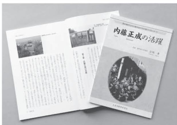
市ゆかりの人物ブックレット