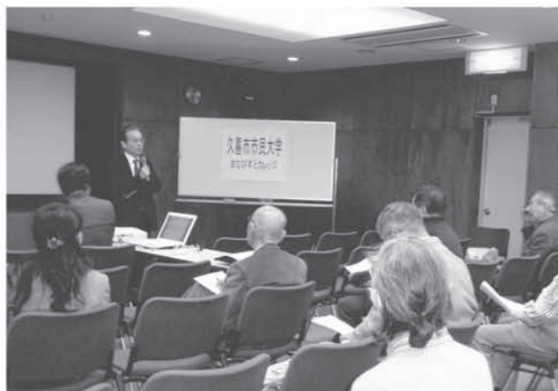
市民大学 第2学年「副学長（教育長）講話」