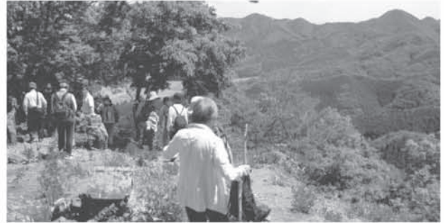
青葉公民館事業 「青葉ハイク」