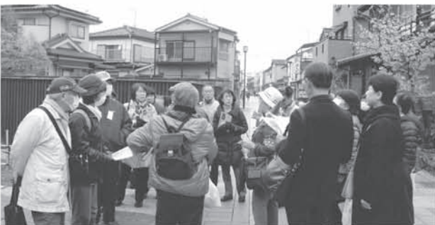
栗橋公民館事業 「再発見！大人の街散歩」