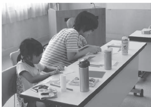
おやこ折り紙教室（鷲宮図書館） 上手に折れるかな？