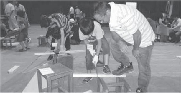
中央公民館事業 「親子木工教室」