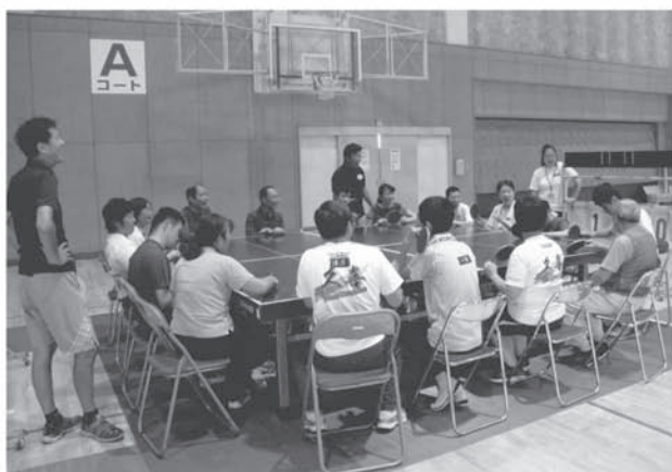
ふれあいスポレク・フェスタ (四面卓球バレー)