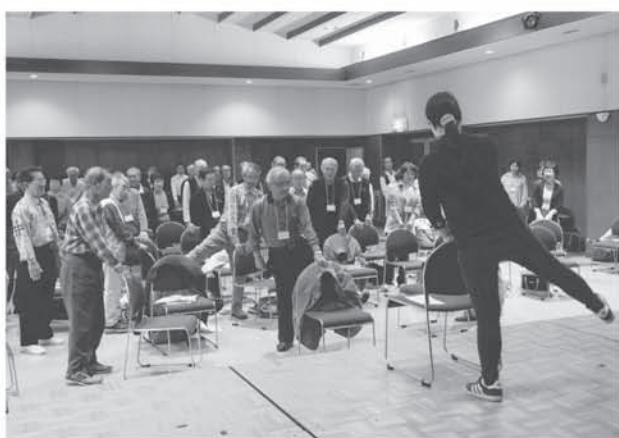
高齢者大学 授業風景「食生活と体力づくり」