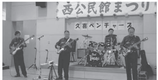
西公民館事業 「西公民館まつり」