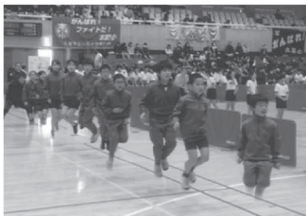
なわとびフェスタ