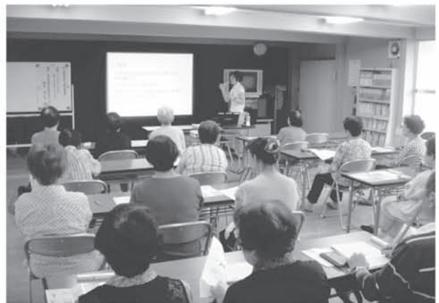
野久喜集会所 人権学習講座