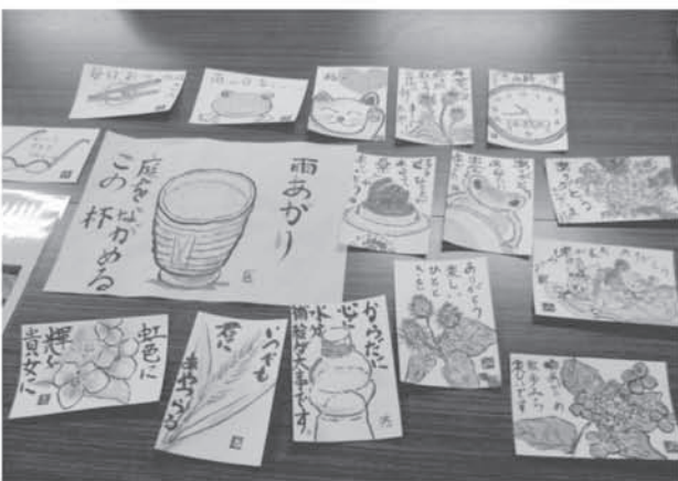
内下集会所 絵手紙教室