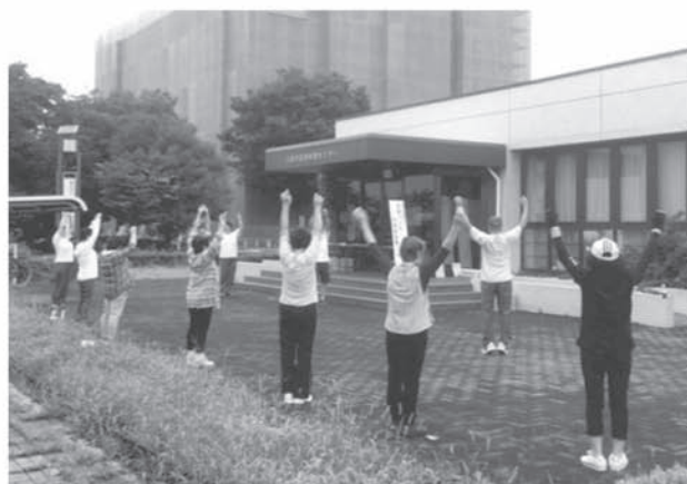
早朝ラジオ体操会