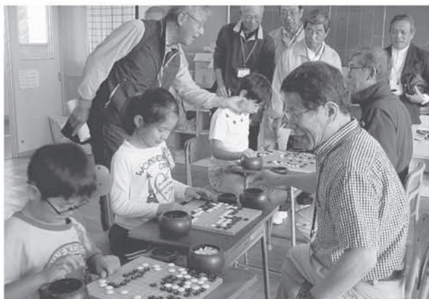
放課後子ども教室 囲碁 (久喜小学校 くきっ子)