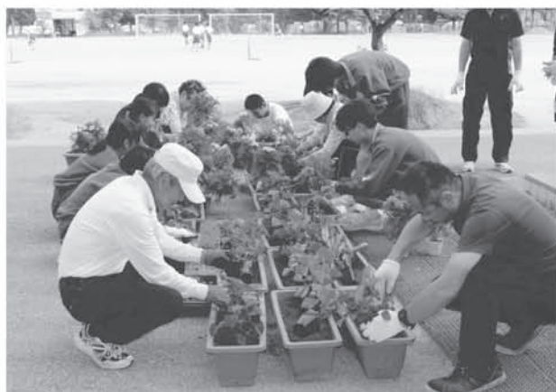
学校・家庭・地域が一体となった教育の推進 環境整備活動【コミュニティ・スクール】 (栗橋東中学校)