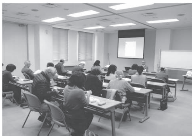
図書館講座（菖蒲図書館） 「古典へのいざない ～三大随筆を読む～」