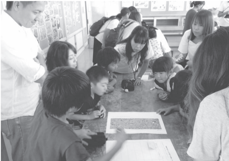
安全教育の推進 地域の方との災害図上訓練(栗橋西小学校)