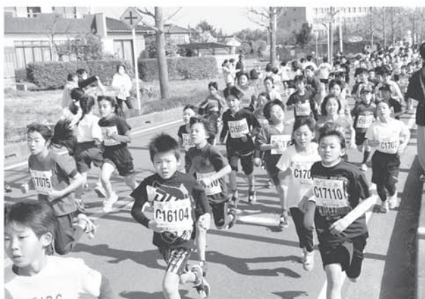
よろこびのまち久喜マラソン大会