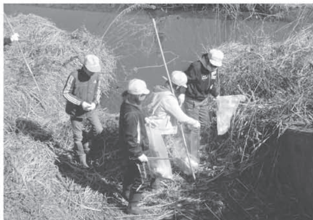
積極的に取り組むボランティア活動 6年生による地域清掃活動 (久喜北小学校)