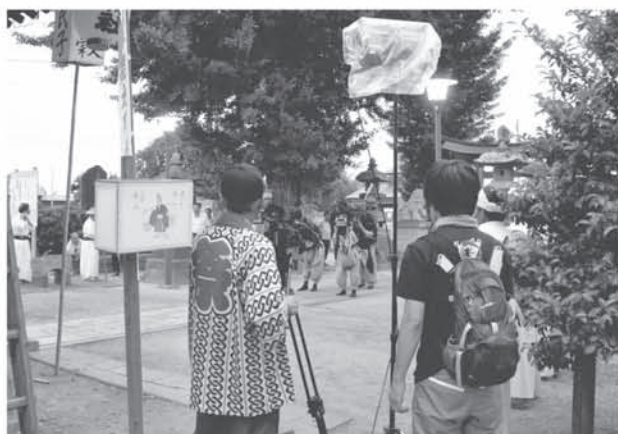
獅子舞映像記録撮影