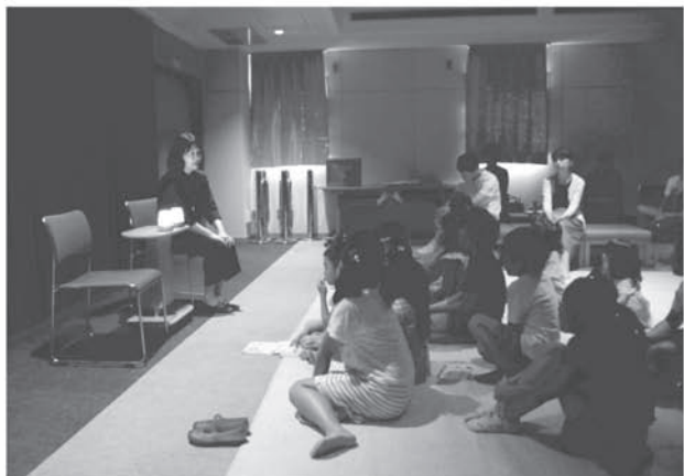
小学生向けおはなし会（中央図書館） 「夏の暗くてこわーいおはなし会」