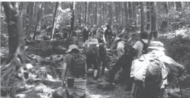
東公民館事業 「健康トレッキング」