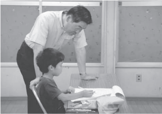
野久喜集会所 算数教室