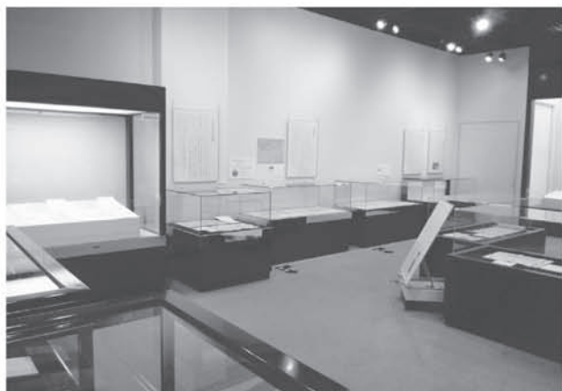
特別展（郷土資料館）