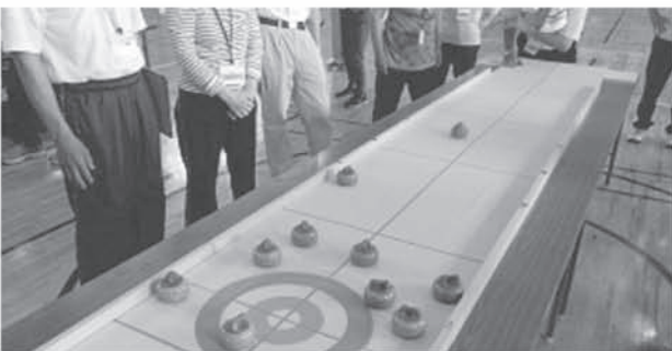
南公民館事業 「カーレット」