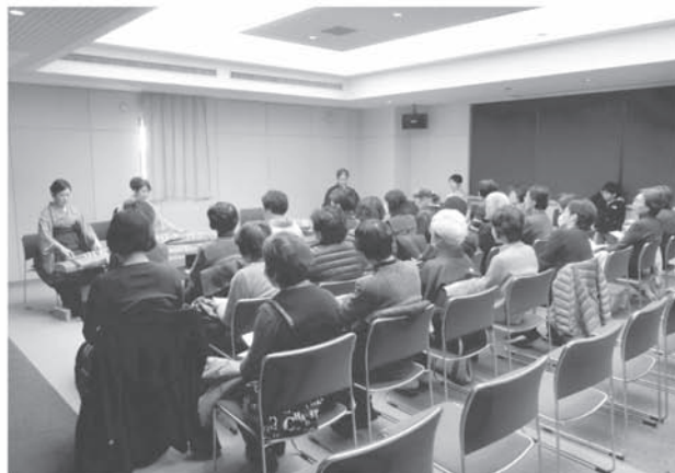
和の響きとおはなしの世界（中央図書館） 「琴・尺八の演奏と昔話の語り」