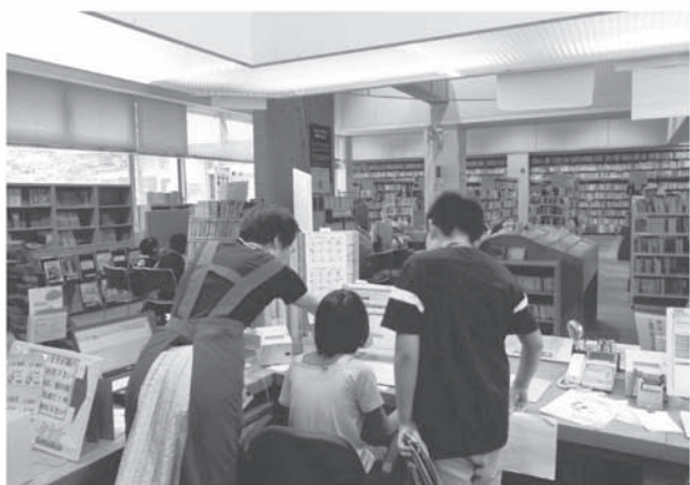
子ども1日図書館員（中央図書館） 「小学5・6年生による図書館の仕事体験」