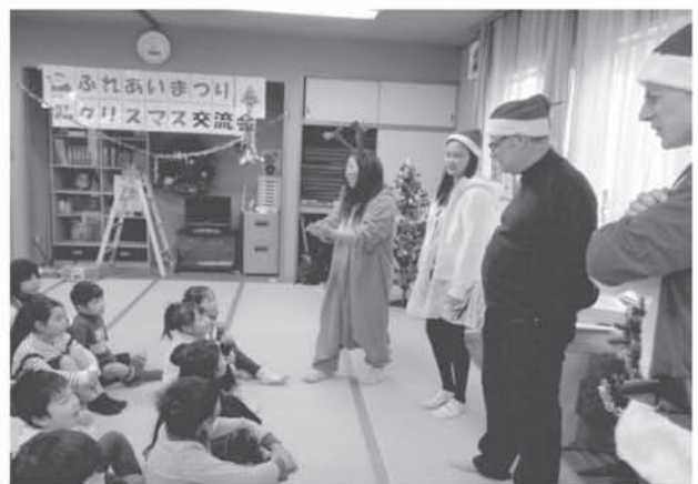
内下集会所 ふれあいまつり