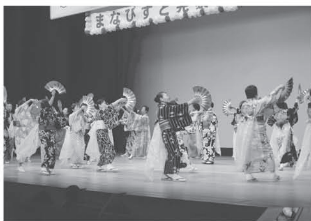
生涯学習推進大会「まなびすと久喜」 大会テーマ「紡ぐ絆 ～過去・現在・未来～」