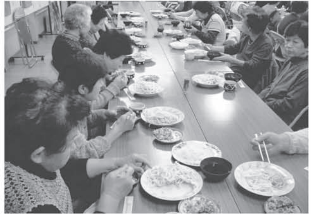
野久喜集会所まつり（そば会）