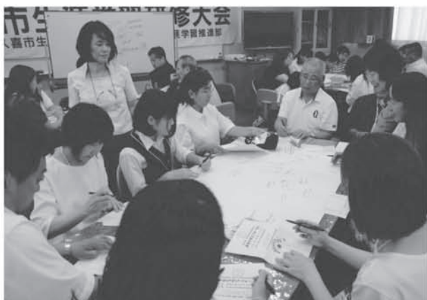
生涯学習研修大会「まなびすとフォーラム」 大会テーマ「深めよう絆！学校・家庭・地域」