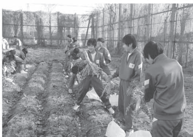
自然と触れ合う体験活動の充実 緑の学校ファーム収穫体験 (鷺宮中学校)