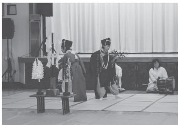
鷲宮催馬楽神楽伝承教室