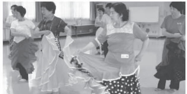
森下公民館事業 「フラメンコ教室」