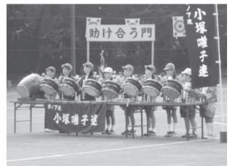
運動会のオープニングセレモニーで「小塚囃子」を演奏している様子