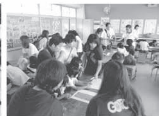
地域の方とのDIG (災害図上訓練)