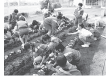
ボランティア生徒による 花壇づくり