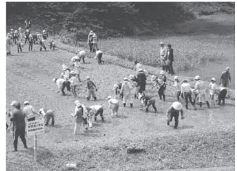
赤倉自然体験教室で田植えを行う 6 年生