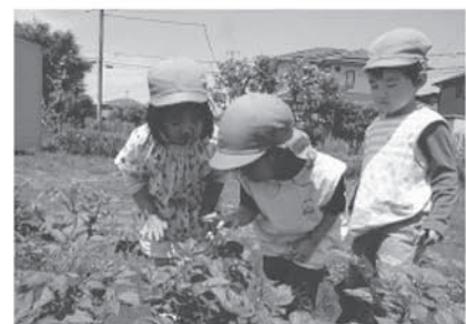
「じゃがいもの花 見つけた！」 「白くて 小さいね」