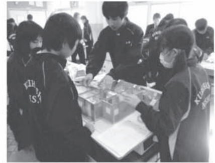
企業と協力した協調学習の授業 「環境にやさしい家づくり」