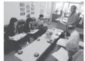
第1回学校運営協議会 (コミュニティ・スクール)