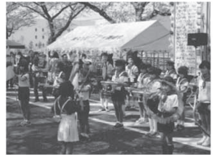
清久さくら祭り 鼓笛隊参加