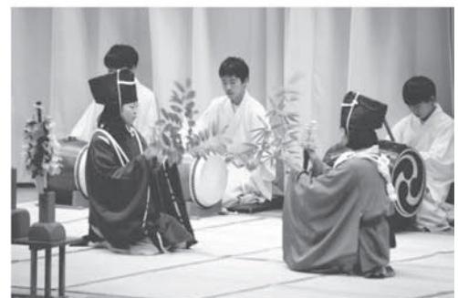
土師一流催馬楽神楽「郷土芸能部」