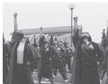
人権の集いのソーラン節