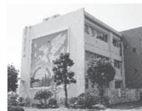
学校のシンボル ペガサス