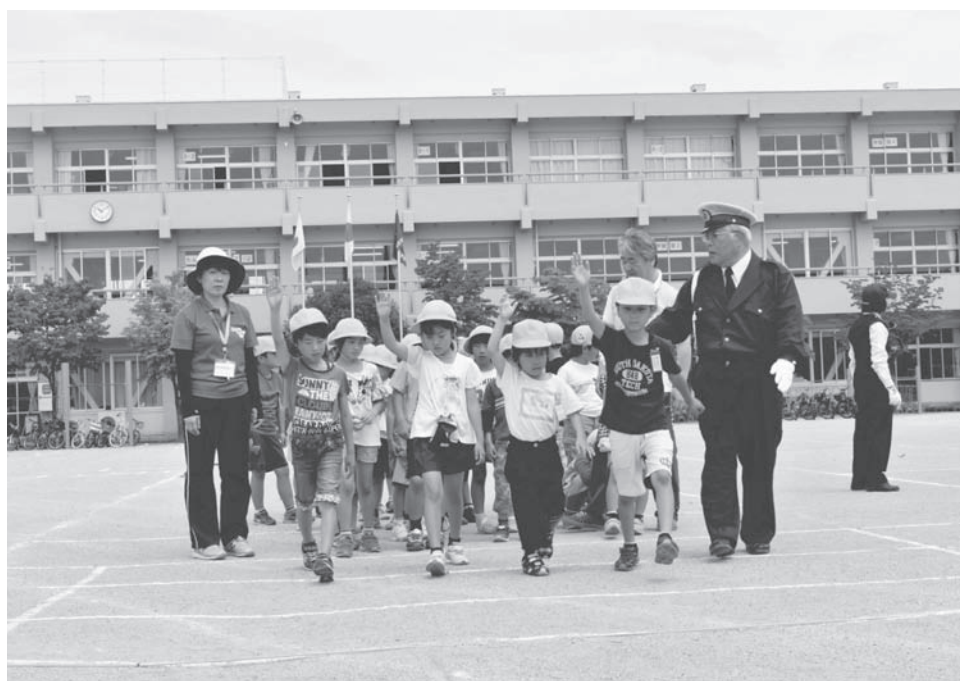
交通安全教室(砂原小学校)