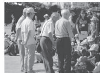
地域と連携した引渡し訓練の実施