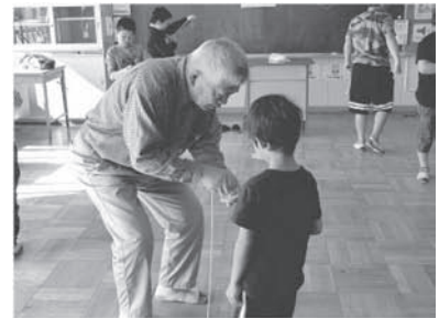
ふれあいフェスティバル 「昔遊び指導」