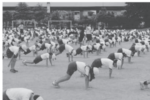
わんぱくタイム（業前運動）