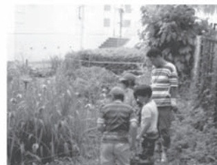
ビオトープを活用した授業実践