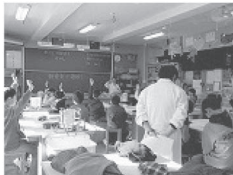
新入生 1 日体験学習で 中学校の学習にチャレンジ