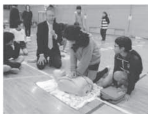
6年 心肺蘇生教室「命の授業」