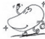
上内小マスコット キラキラくん