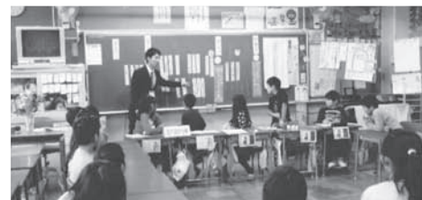
よりよい生活や人間関係を築く学級活動