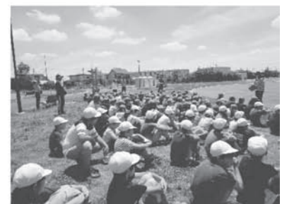
全校合同校外学習

※凡事徹底し子どもとともに学ぶ、豊かな人間性を備えた使命感と情熱を持った教師集団がこの目標を具現化し、「子どもあるところ、教師がいる学校」「知恵を出し、汗をかき、夢の持てる学校」を作り上げる。