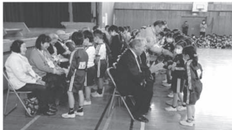
地域の方への感謝の会