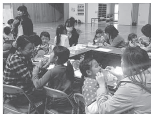
親子ふれあい活動1年生