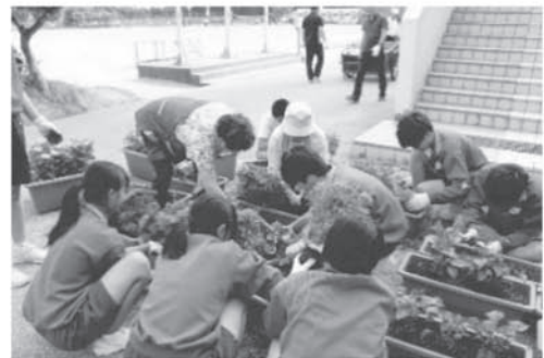
生徒と地域の方々との交流