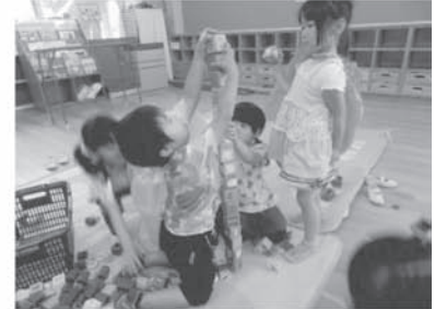
4 歳児「仲良く積み木遊び」