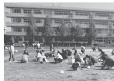
親子サタデー・ボランティア による校庭除草