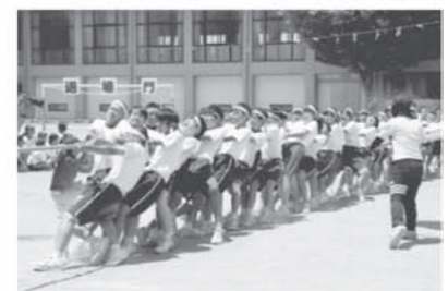
縦割り団で上級生と下級生が 一つになる綱引き