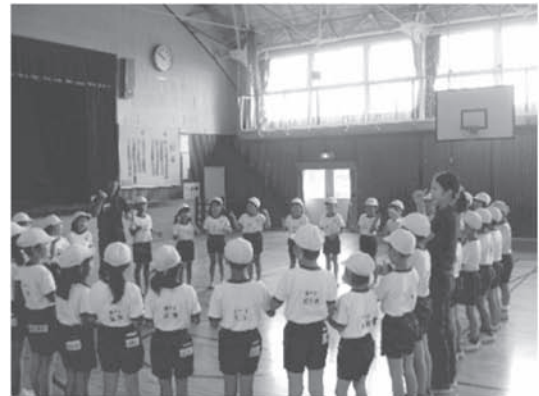
江面第二小学校とのWeプラン（3年生）