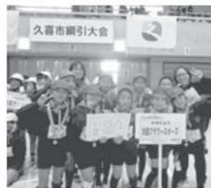
久喜市綱引き大会