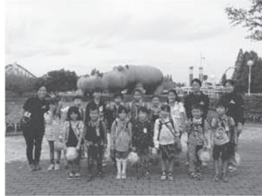
「かがやき班」で東武動物公園へ