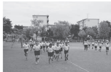
朝マラソンの様子