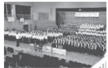
『青葉祭(合唱祭)』での全校合唱