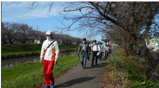
東公民館事業 「大人の健康教室～ウォーキングを始めよう!～」