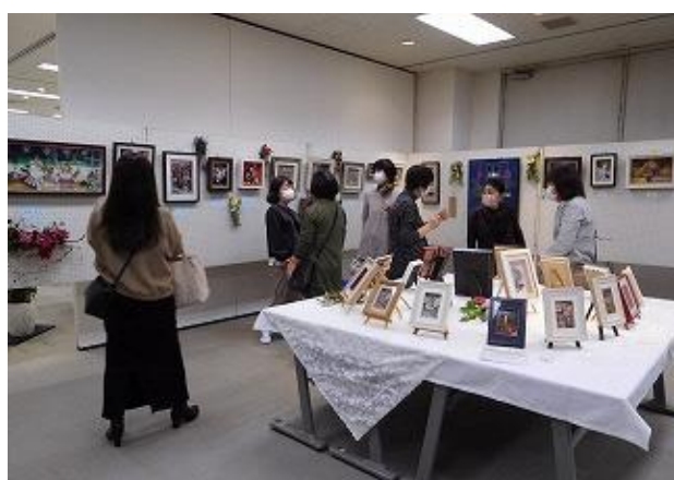
市民文化祭（菖蒲地区）

市内中・高吹奏楽部、市民吹奏楽団によるフェスティバルを開催しYou tubeで公開しました。