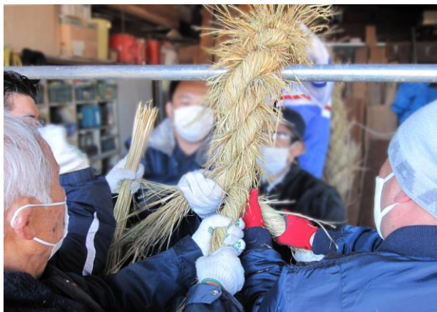
鷲宮神社の注連縄作り調査