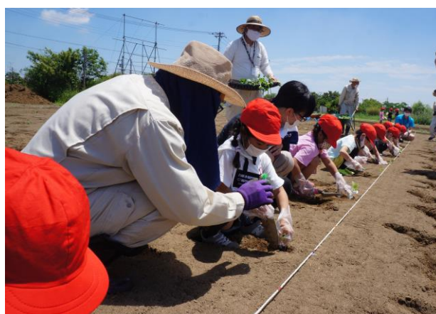
学校・家庭・地域が一体となった教育の推進 しょうぶ会館と連携したかぼちやの苗植え体験 (菖蒲小学校)