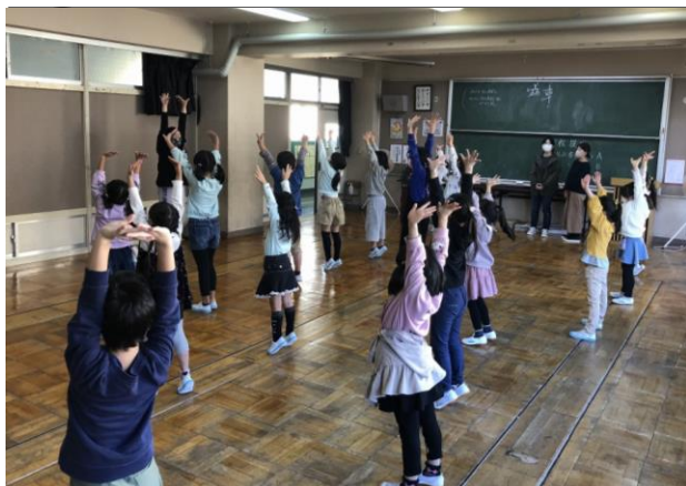
放課後子ども教室 (さくらっ子ゆうゆうプラザ)