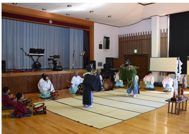
郷土資料館主催の鷲宮催馬楽神楽伝承教室