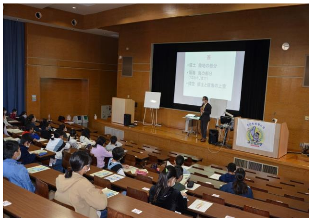
子ども大学くき (平成国際大学)