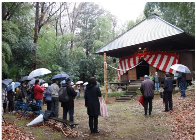
正法院薬師堂のご開帳調査