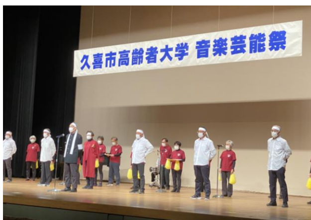
高齢者大学 「音楽芸能祭」