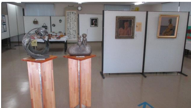
南公民館事業 「南公民館まつり」