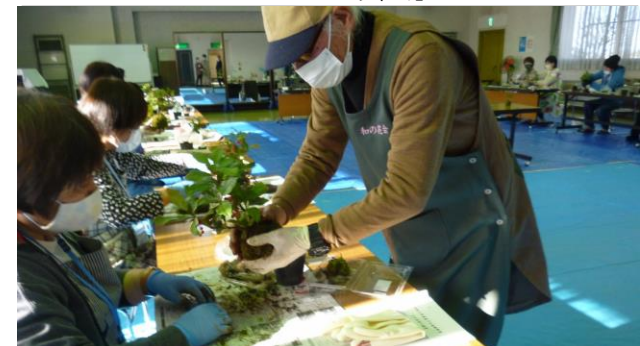
森下公民館事業 「コケ玉作り教室」