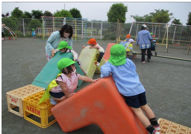
遊びの中で意欲をはぐくむ幼児教育 自分たちでイメージを膨らませながら並べ替えて遊ぶ幼児 (栗橋幼稚園)