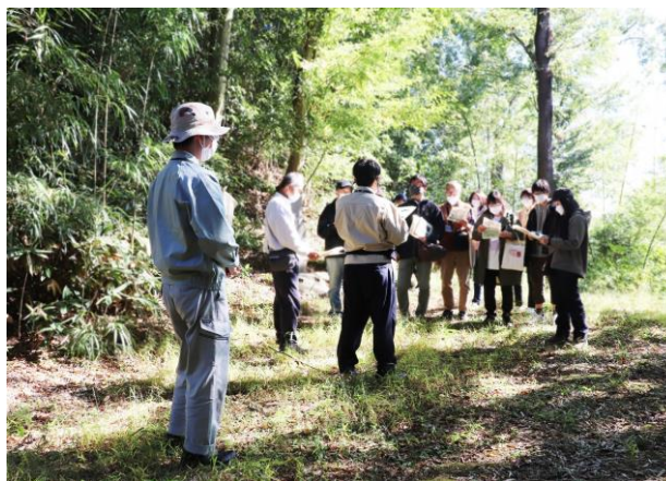
埼玉県主催の古墳ツアー 天王山塚古墳案内