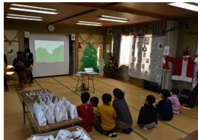
野久喜・内下集会所交流事業 「ふれあいまつり」