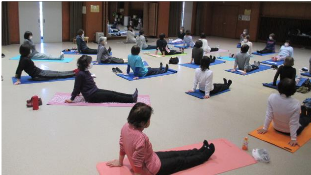
中央公民館事業 「初めてのヨガ教室」