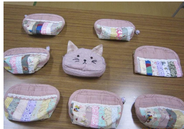
内下集会所 手芸教室