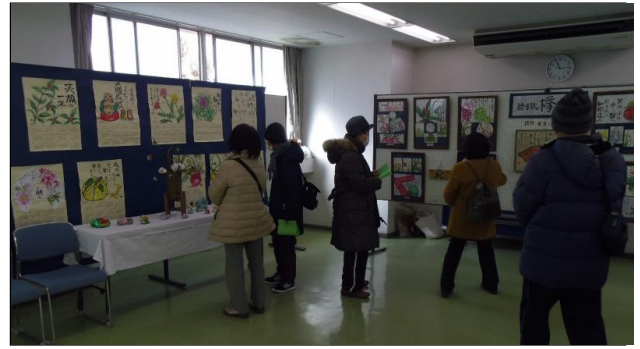
青葉公民館事業 「青葉公民館まつり」