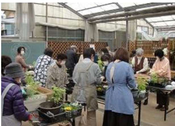
野久喜・内下集会所交流事業 「寄せ植え教室」