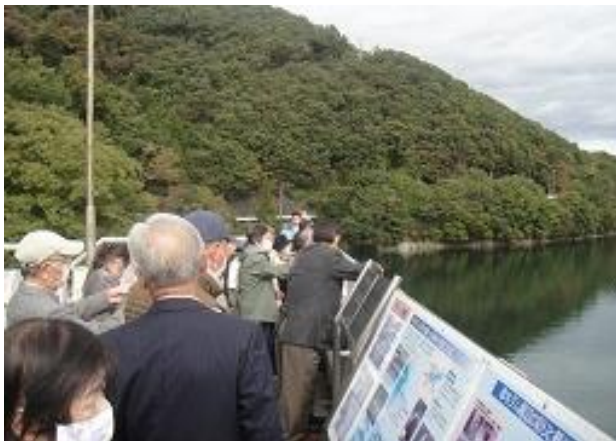
野久喜集会所 防災教室 草木ダム（群馬県みどり市）