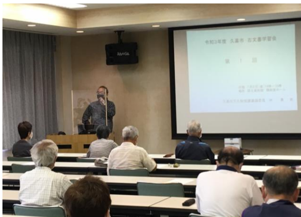
郷土資料館主催の古文書学習会