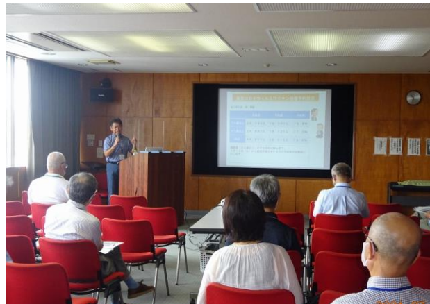
市民大学 「学長講話」