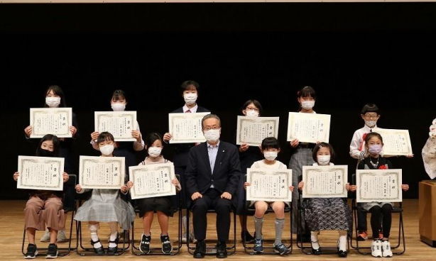
久喜市図書館を使った調べる学習コンクール

第1回久喜市図書館を使った調べる学習コンクール（全館） 図書館の本やフィールドワークをとおして、調べ上げられた力作ぞろいでした。