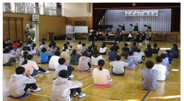
西公民館事業 「ふれあい鑑賞会」