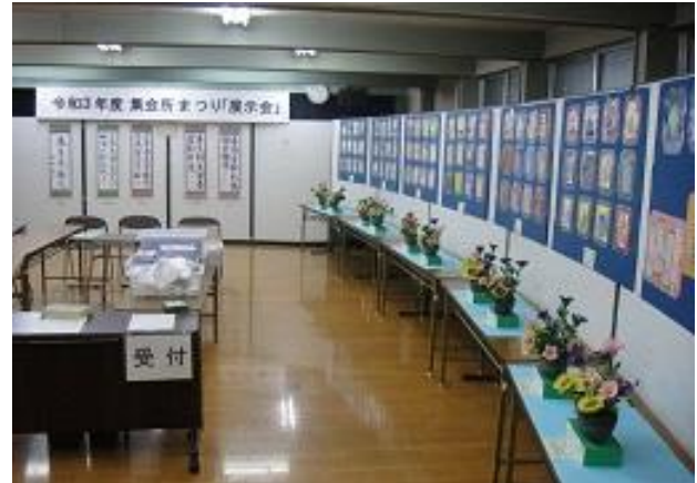
野久喜集会所 集会所まつり