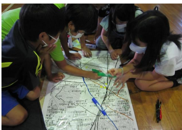
安全教育の充実 災害図上訓練 DIG (久喜東小学校)