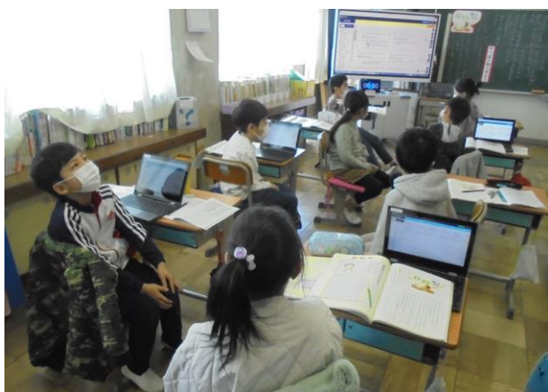
豊かな人間性をはぐくむ教育の充実 考え、議論する道徳の授業 (栢間小学校)