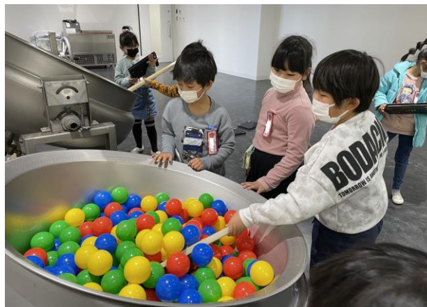
学校給食の充実 学校給食センター見学会 (青葉小学校)