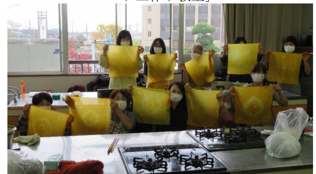
鷲宮公民館事業 「玉ねぎの皮を使った染め物講座」