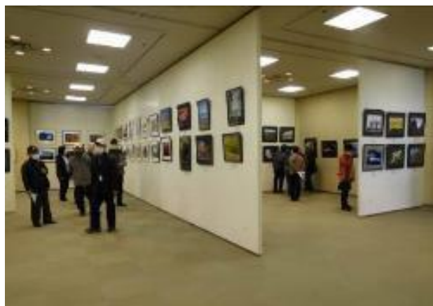
久喜市美術展（写真）