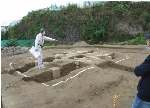
栗橋の北2丁目陣屋跡の遺跡見学会