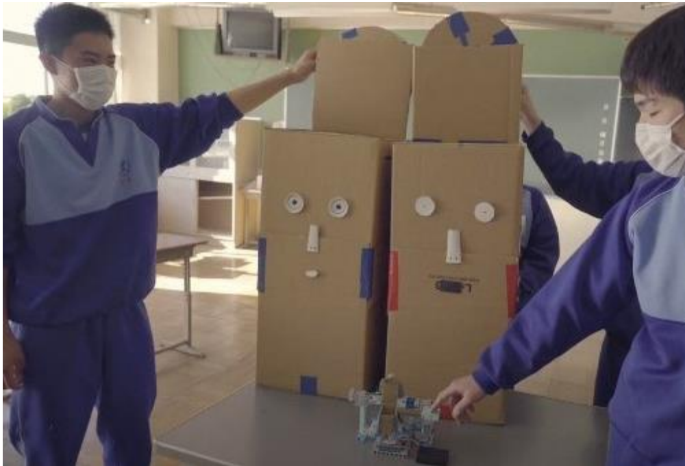
企業と連携し、SDGs実現に向けた教科横断プロジェクト型学習 (太東中学校)