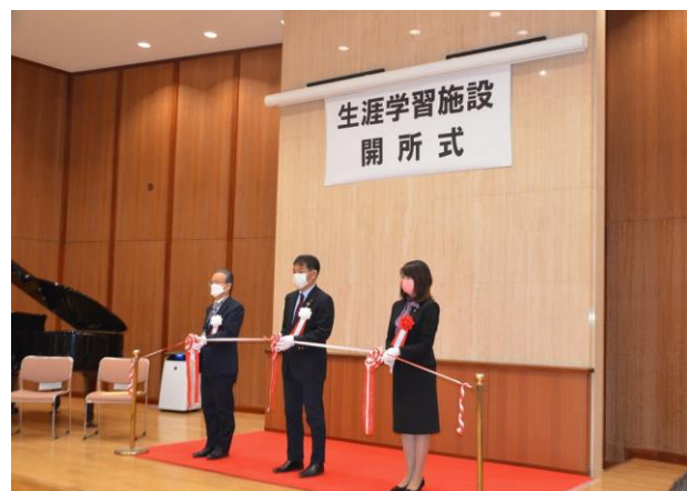
生涯学習施設「まなびすぽっと」開所式 (鷲宮総合支所5階)