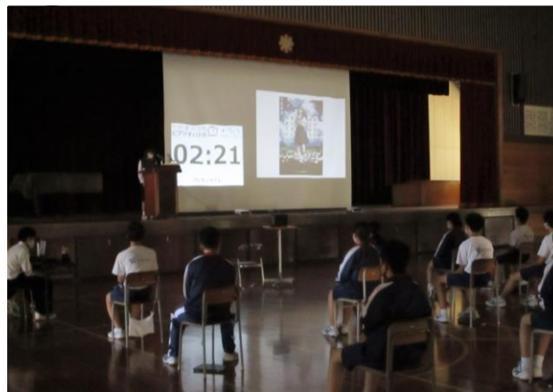
学ぶ意欲と確かな学力をはぐくむ教育の充実 おすすめの本をプレゼンするビブリオバトル (鷺宮西中学校)