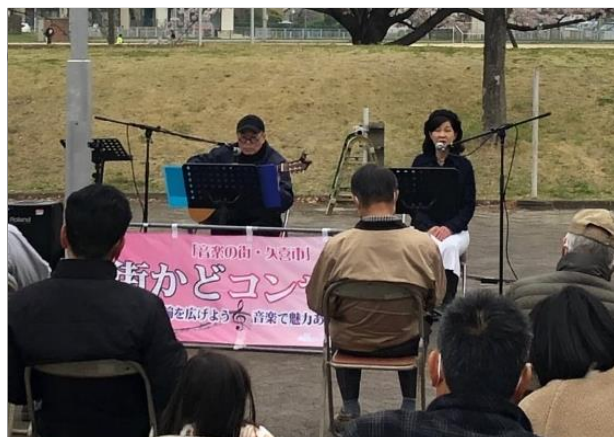
街かどコンサート