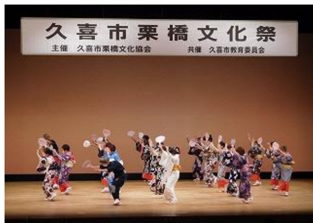
市民文化祭（栗橋地区）