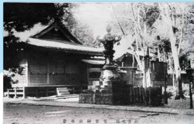
かなどうろう 金灯籠

大正15年（1926）まで、鷺宮神社には鳥居が二つあり、一の鳥居は現在の「鷺宮駅入口」交差点付近にありました。現在の鷺宮神社の鳥居は二の鳥居にあたります。