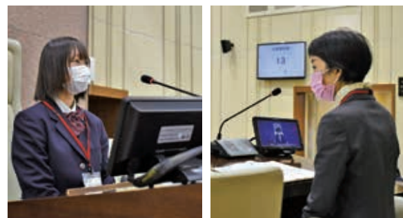
正副議長の進行のもと、活発な議論が交わされました