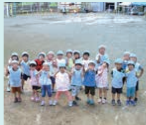
そら組のみなさん