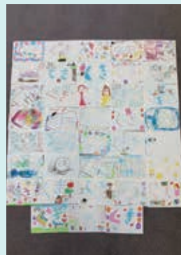
どれも素敵な作品でした

栗橋幼稚園は、栗橋コミュニティセンター「くぶる」と隣接する公立幼稚園。現在の建物は2006年に建設されました。広い園庭で走り回ったり、園の畑で虫取りをしたり、園児の皆さんは元気いっぱい！素敵な作品を描いて下さり、ありがとうございました！