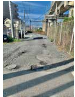
舗装の打ち替え工事をする市道久喜5232号線