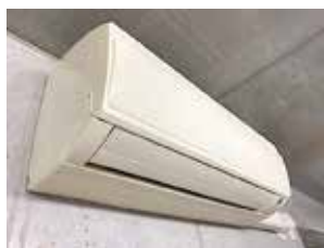
熱中症から命を守るエアコン

答 生活保護968世帯のうち、45世帯が設置されていない。低所得世帯は把握していない。