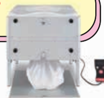
自動ラップ式災害用トイレ