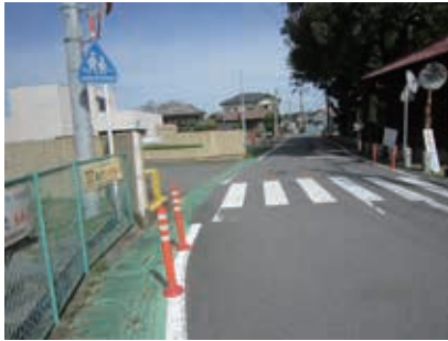
栢間小学校前の通学路

答 学校から上がってきた危険箇所については、杉戸県土整備事務所で取りまとめを行う。そして各施設管理者が整備計画をつくり、各管理者が整備をしていく。