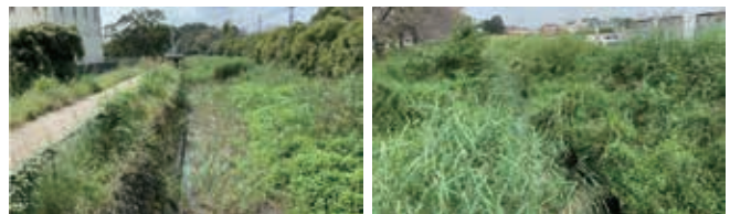
川床の管理は災害対応の一つだ

答 管理者の県土整備事務所に確認したところ、平成28年度より清久大池周辺中心浚渫を順次進めており、令和2年度までに約950mを実施し、堆積土砂の処分量は約1,300m 3 とのことだ。また、令和3年度にも西谷大橋より上流区間の浚渫と所久喜地内の前堀新橋から下流域で河道に自生する樹木の伐採を予定しており、適正な管理に努めているとのことだ。