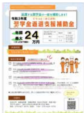
加古川市の奨学金返還支援補助金案内