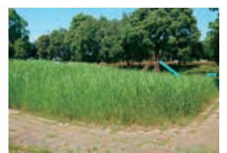
草に埋もれた滑り台 (菖蒲温水プール)

意見 縦割り行政を一度排して、除草という問題を考えて欲しい。財政から予算をつけないと除草回数も増えない。予算の割り振りも考えて欲しい。