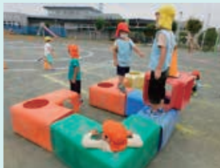
し字トンネルで迷路遊び