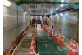
工事中の東鷲宮駅地下道