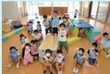
にじ組のみなさん