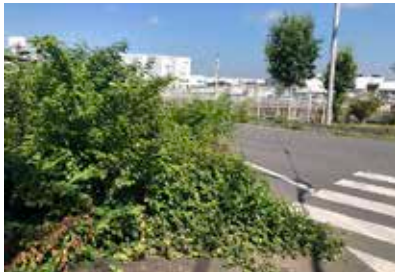
交差点の視野を阻害している植樹帯

答 信号機や横断歩道があって多くの歩行者が横断するようなどころや、危険性が高いところは植樹帯の撤去も検討する。植栽によって交通事故リスクが高まっていることは認識している。