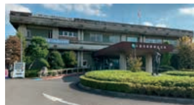
除却とされた栗橋総合支所

答 何を無くして何を残すのかではなく、全体の行政サービスをどうするのかの視点から考える。