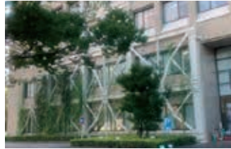
耐震工事された市役所

問 これは稀にみる良好な数値であり、こと中性化に関して市役所は、ほとんど劣化していないということに明らかになったことになる。市民から預かった大事な資産。これからもいっ