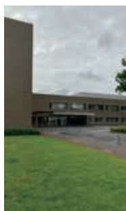
売却になっている理科大跡地

答 1億円以上の維持費がかかる。新たな社会情勢、市の公共施設を全体で考える時期であり、財政負担を考慮し、理科大は断念をした。