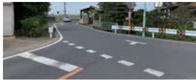
加須市境の危険な変則5差路

て同盟会結成の働きかけを行った。県は、加須市において現在進行している区間の整備をまずは優先して実施し、その後久喜市内の未整備区間を着手する予定。