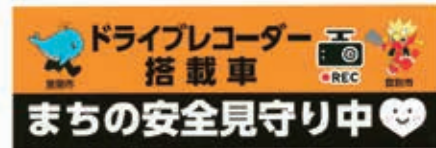
室蘭市のHPより「まちの安全見守り中」ステッカー

答 事例を参考にするとともに、警察署や関係機関との協議を行い効果的な運用方法について検討。