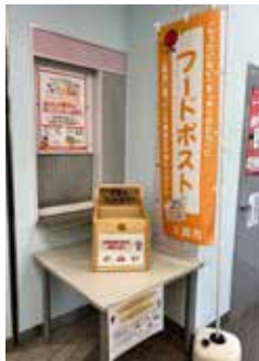
鷺宮郵便局に設置された フードポスト

答 ①これまで食品ロス削減に関する啓発を行ってきた。本年10月以降に市民の皆様を対象としたフードドライブの実施を予定している。②市内の郵便局や公共施設に常設の