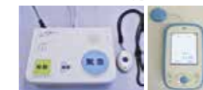
(左) 固定型 (右) 携帯型

1人暮らしの高齢者などに自宅で緊急事態が発生した場合に、専用の装置を使い、民間の受信センターを経由して救急車の手配等をします。電話にて看護師の健康相談や安否確認も行います。