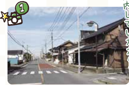
▲日光街道の現在。道幅は江戸時代から変わっていないという。また、宿場町の風情を感じさせる建物も一部残っている。