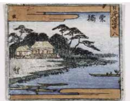
歌川広重『日光道中栗橋』

関所は廃止となりました。栗橋関所のあった位置は、現在は利根川河川敷となっており、その痕跡を見ることはできませんが、利根川橋のやや上流部付近と考えられています。大正13年（1924）に地元の人たちによって「栗橋関所址」碑が建てられました。この碑が目標物となって、現在、「栗橋関跡」として県の旧跡に指定されています。