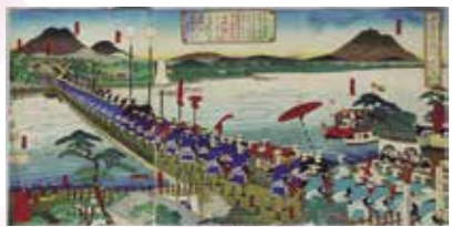
『中古倭風俗 日光御社参 栗橋渡し船橋之図』

将軍が家康を祀る日光東照宮へ参拝する際、通行で最大の障壁となる利根川には船橋が架けられた。川に船を並べて上に板を敷くなど、架橋は大工事であった様子がわかるが、一般の通行は許されず、将軍が日光から戻ると直ちに撤去された。