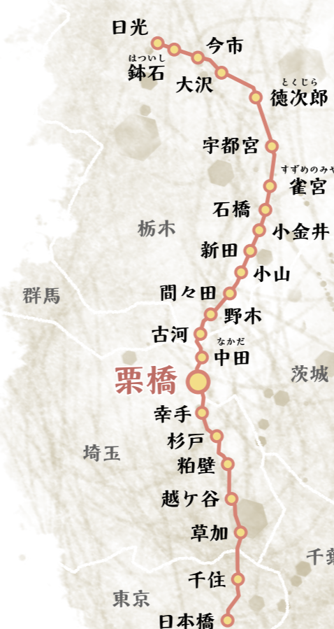
栗橋関所を再現した模型 (久喜市立郷土資料館にて展示)

江戸時代に整備された五街道の一つで、日本橋から現在の栃木県日光市までの21宿からなる全長約140kmの街道。江戸幕府の開祖である徳川家康を祀る東照宮のある日光へ、歴代将軍が参拝する際に通行した街道として特に重要視された。