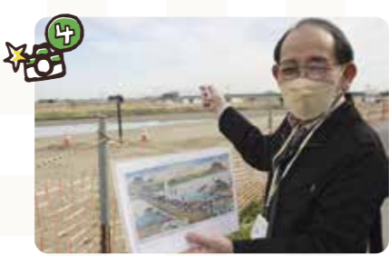
▲日光社参の際には数多くの人や馬が動員され、船橋を渡った。「将軍が日光に着いたとき、最後尾はまだ江戸にいた…なんていう話もあります(笑)」

栗橋宿は利根川の舟運業で栄え、特に来年で設置400年を迎えることされる栗橋関所は、箱根・碓氷と並んで関東三大関所と呼ばれ、江戸の警備拠点として重要な役割を果たしていました。ぜひ皆さんにも、栗橋にとってだけでなく、久喜市全体の大事な歴史の一つとして、栗橋宿について知っていただきたいですね。