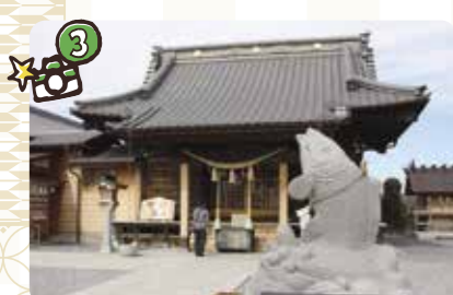
▲八坂神社には狛犬ならぬ狛鯉が。境内の建造物や石造物等には鯉と亀をモチーフにした装飾が多い。