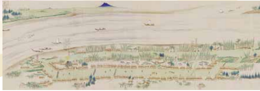
『日光道中絵図』 (国立公文書館蔵) 文政8年（1825）に予定されていた、11代将軍徳川家斉による日光社参に備えて描かれた栗橋宿の街並み。