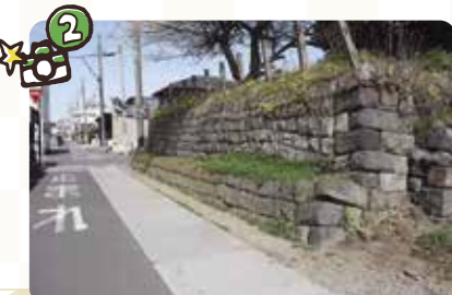
▲街道の近くには、当時の商人が敷地内に築いたと思われる水塚の跡が残っている。