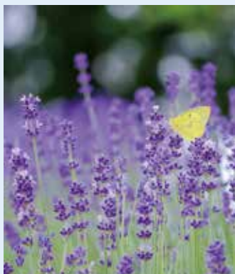
【幸せの訪れ】 菖蒲行政センターラベンダー畑