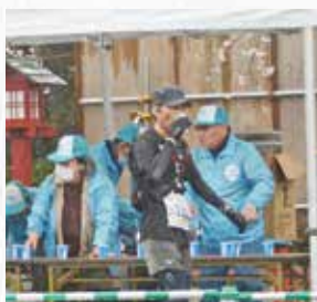
スポーツを「ささえる」

久喜市では、スポーツを通じて人を元気にし、まちを活性化させるため、今年3月に久喜スポーツコミッションを立ち上げました。コミッションのネットワークで連携してスポーツ振興に取り組み、一丸となって久喜市を盛り上げていきます。