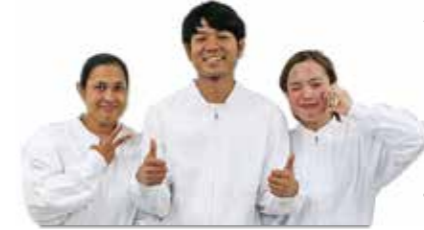
特定技能外国人の皆さん

からの若い方々を受け入れ商品を作っています。日本のルールや文化にも順応して頑張っており、働きを評価された特定技能外国人は現場のリーダーとなって活躍しています。海外人材支援課は、生活面でトラブルになりやすいごみ出しルールの教育や、各種手続きのサポート、また学習面で日本語学習のサポートや技能試験の勉強会を行うなど、外国人の方が日本で活躍していただけのように教育や支援をしています。