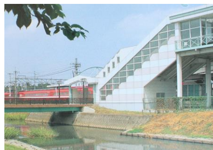
橋上化した東武鷺宮駅 (平成4年建設)