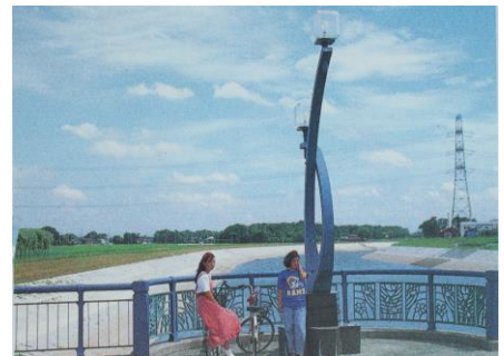
太平橋 (昭和62年建設)