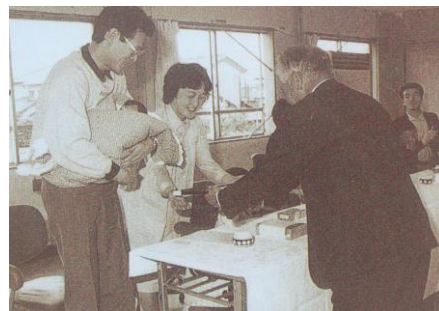
3万人目の町民 (平成元年)

人口 30,251人 世帯数 8,842世帯 町域面積 13.90km 2 予算規模 60億円 町の花 コスモス 町の木 月桂樹