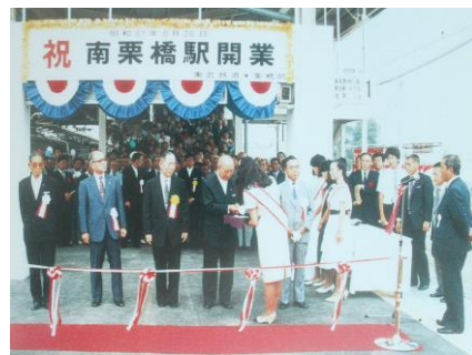
東武南栗橋駅開業 (昭和61年開業)

人口 20,634人 世帯数 5,585世帯 町域面積 15.78km 2 予算規模 44億円 市の花 サルビア 市の木 きんもくせい