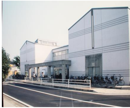
久喜市立図書館 (昭和62年建設)

人口 63,572人 世帯数 18,932世帯 市域面積 25.03km 2 予算規模 131億円 市の花 梨 市の木 いちょう