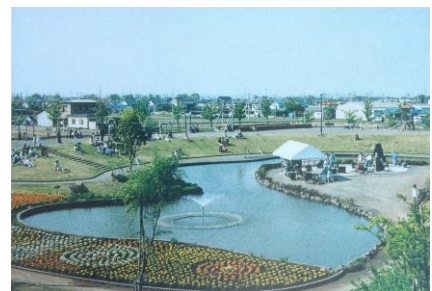
しらすぎ公園 (平成3年建設)