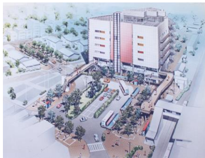
久喜駅西口再開発予定図 (平成元年頃)