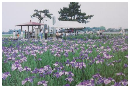
あやめ祭り (平成3年第1回開催)