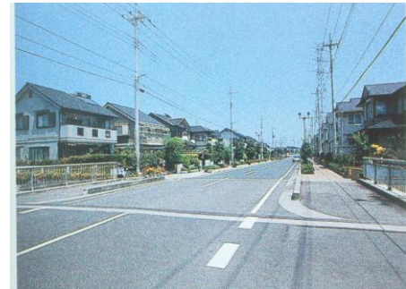
南栗橋地区の街並み