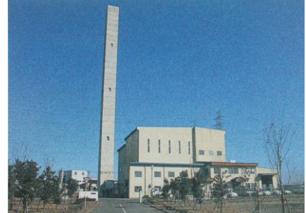
菖蒲町清掃センター (平成元年建設)