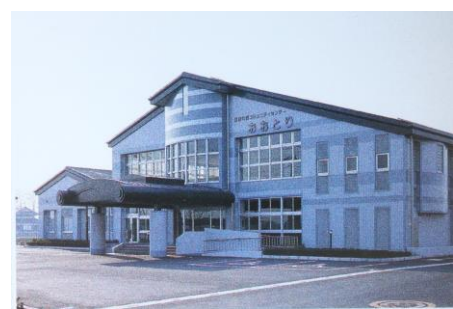
西コミュニティセンター (おおとり) (平成5年建設)