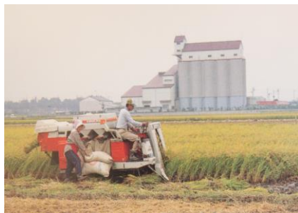
カントリーエレベーター (昭和62年建設)

人口 21,757人 世帯数 5,659世帯 町域面積 27.37km 2 予算規模 43億円 町の花 あやめ 町の木 さくら