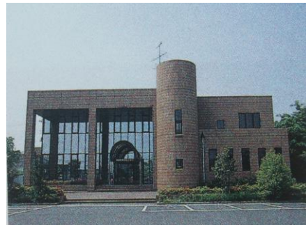
栗橋保健センター (昭和63年建設)