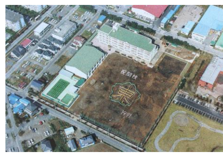
東鷺宮小学校 (平成3年建設)