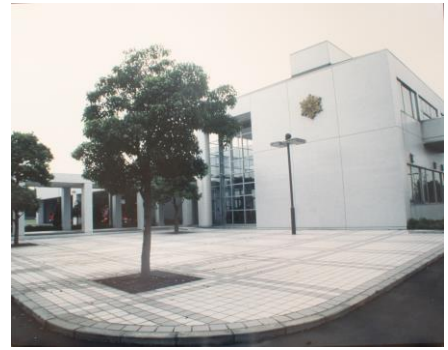
久喜地区消防組合消防本部 (平成元年建設)