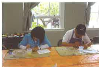
ロックペイント作成中

アンブクア美術館の工作室に大小さまざまな石と絵具・筆が準備されていました。有難いことに、多種多様な図案の型紙も沢山用意されていました。簡単そうと選んだ図柄もいざ描き始めてみると難しく、選んだ図柄とは別物のペイントとなってしまい苦笑した次第です。他の方々と同様に久しぶりに童心に帰って楽しい一時を過ごすことができました。