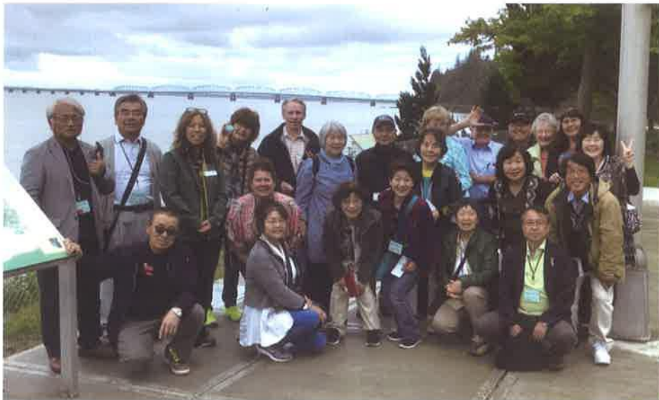
6月14日 アストリア橋をバックに記念撮影