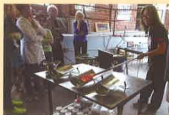
ガラス吹きを体験