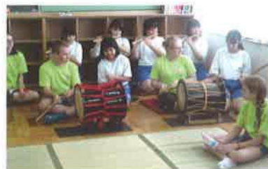
伝統の神楽を体験

ローズバークの友だち17名が、1泊12日の日程で、引率者3名とともに7月13日に来市されました。訪問団の皆様泊まり先は、本事業の目的・意義に賛同し快く受け入れてくださった18の家庭です。ホームステイ9泊10日という短いものでしたが、記録的な猛暑の中それぞれの家庭にて交流を深めました。そして、24日にホストファミリーと惜別の別れをし、久喜をあとにしました。