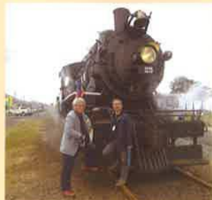
ガリバルディ列車の前で

この2泊3日のバス旅行は、ローズバーグの皆さんが私たちのために早い時期から計画し、下見もして見学地やホテルを選定くださったと聞いています。20年以上の交流の積み重ねと、細やかで温かい心遣いを感じた旅でした。