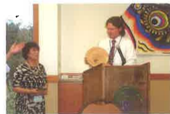
永年の協力に 感謝のことばをいただきました

10年ぶりの訪問は、変わらぬ親切とやさしさ、友情の再確認の旅でした。まだ、参加されたことの無い方々、ぜひ参加し、体験してください。夢中になります。人生観が変わります。友情が生まれます。友好親善に繋がります。