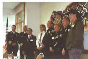
歓迎会（来賓の皆様）