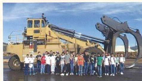
2017年 木材工場見学の中学生