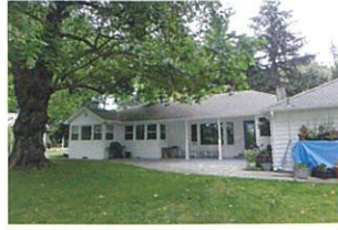
家のバックヤード