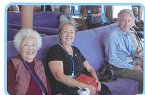
最高齢のマーサさん、 元気に全日程を