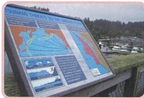
オレゴンコースト 津波到達の表示