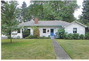
テリー家を正面から