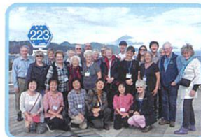
清水港・土肥までの フェリー乗船前に