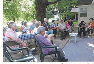
バックヤードでのホームパーティー・視線は故新井会長の手品へ・楽しい時間でした