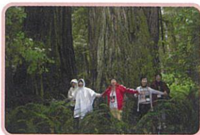
巨木の森 レッドウッドの大きさに驚愕