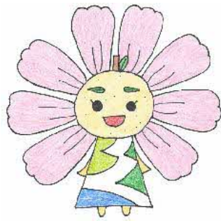
久喜市内小・中学校 マスコットキャラクター 「はぴるん」